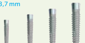
SPMB8 SPMB10 SPMB12 SPMB14