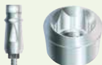
FMSM im Lieferumfang des Implantats enthalten

Ø 3,8 mm Implantatplattform SPMB Serie (Innensechskant)