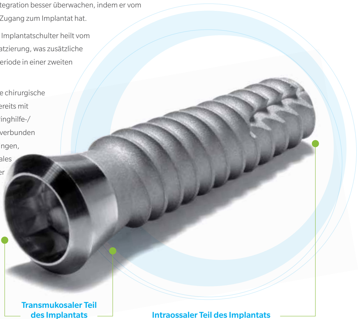
Transmukosaler Teil des Implantats