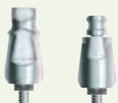
FMSW (inklusive Implantat) OPA/6

Ø 4,8 mm Implantatplattform Ø 6,0 mm Konus