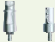
FMS inklusive Implantat OPT/5