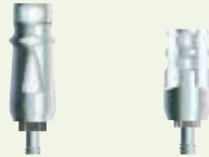
FMSM inklusive Implantat SPMT