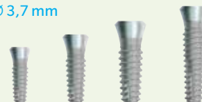
SPB8 SPB10 SPB12 SPB14