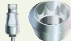
FMSW inklusive Implantat

Ø 4,8 mm Implantatplattform SPWB und OPWB Serie (Innenachtkant)