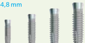
SPWB8 SPWB10 SPWB12 SPWB14