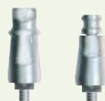
FMS (inklusive Implantat) OPA/5

Ø 4,8 mm Implantatplattform Ø 6,0 mm Konus