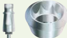
FMS inklusive Implantat

Ø 4,8 mm Implantatplattform SPB und OPB Serie (Innenachtkant)