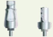
FMSW inklusive Implantat OPT/6