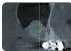
Tomografía axial computarizada mediante haz cónico (CBCT) 4 meses después de la operación.

Los resultados individuales pueden variar.