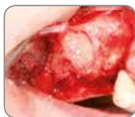
Elevación del seno maxilar usando partículas de hueso esponjoso del aloinjerto Puros.