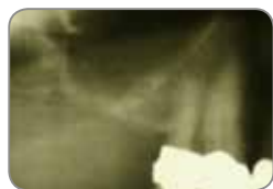
Radiografía de la situación inicial.