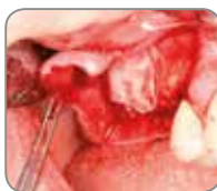
Membrana de pericardio CopiOs colocada sobre ventana lateral.