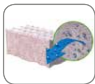
4. Tratamiento con disolventes