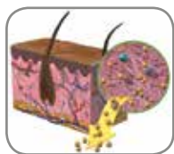
1. Tratamiento alcalino

El proceso patentado Tutoplast garantiza el más alto nivel de seguridad y calidad de tejido con un riesgo mínimo de transmisión de enfermedades. 4 El proceso conserva la valiosa matriz de colágeno y la integridad del tejido a la vez que inactiva los microorganismos patógenos y elimina cuidadosamente sustancias no deseadas, como células, antígenos y virus. 4 El resultado que se obtiene es un tejido seguro y biocompatible.