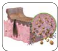
2. Tratamiento osmótico