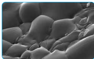
SEM de 3000 aumentos