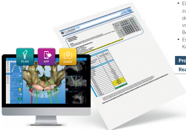
RealGUIDE Software-Suite mit PLAN-, APP-, GUIDE-Modulen

Die Kit-Informationen sind in der RealGUIDE Software-Suite abrufbar, einem offenen System für Diagnose und fortschrittliches Bohrschablondesign, das Sie mit maßgeschneiderten Bohrberichten unterstützt, damit Sie optimal für die zahnärztliche Implantattherapie vorbereitet sind.